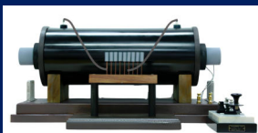
三六式無線電信機